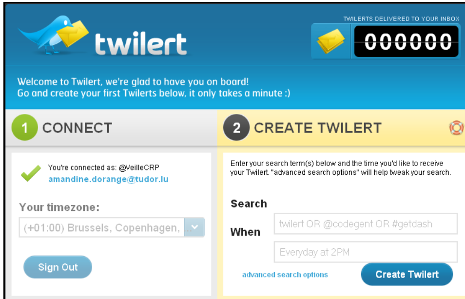
Interface de Twilert

Enfin, sur le même modèle, Twilert permet de paramétrer des alertes sur le contenu de Twitter en choisissant la fréquence de réception, la langue des tweets, l'émetteur ou le destinataire des tweets, la localisation avec la possibilité de spécifier un périmètre (en kilomètres ou en miles), la présence de liens ainsi que le contenu des tweets (☺, ☹ ou question). Une fois les alertes paramétrées, il est possible de suivre dans un tableau de bord la liste, le prochain envoi, le dernier envoi et d'activer ou non les alertes (« on » ou « off »).